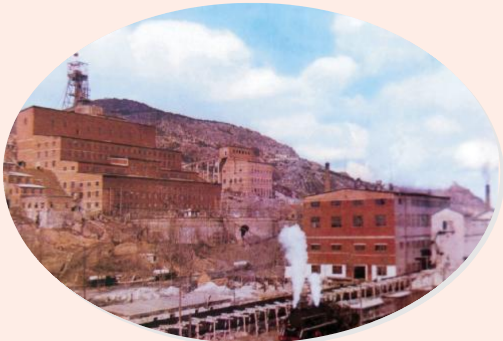
上世纪80年代的锦屏磷矿

锦屏磷矿是国内发现时间最早、开采历史最长、当年规模最大、最早形成的现代大型采选联合企业的化学矿山。在历史上,为中国化学矿山的发展建设作出了卓越的贡献,被业界誉为“中国化学矿山的摇篮”。随着矿产资源的枯竭,锦屏磷矿逐步从辉煌走向衰亡。尽管如此,锦屏磷矿作为连云港市工业遗产乃至国家的工业遗产这一重要历史价值,将永远载入史册。为了充分发挥这一宝贵的工业文化遗产的历史作用,作为当代人应对之进行很好的保护,在保护的基础上加以开发利用,使其继续服务于社会。