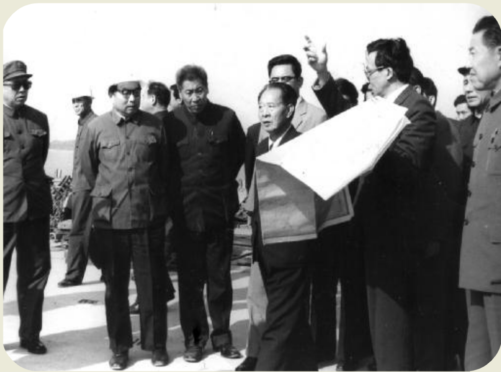
胡耀邦在省市和建港指挥部负责同志陪同下视察建设中的连云港庙岭煤码头

1984年10月27日，时任中共中央总书记的胡耀邦，在中央办公厅主任王兆国及中央有关部门负责人的陪同下，由山东省日照经江苏赣榆县到连云港市视察。下午4时30分一下车，胡耀邦就听取连云港市委、市政府和连云港建港指挥部的汇报。