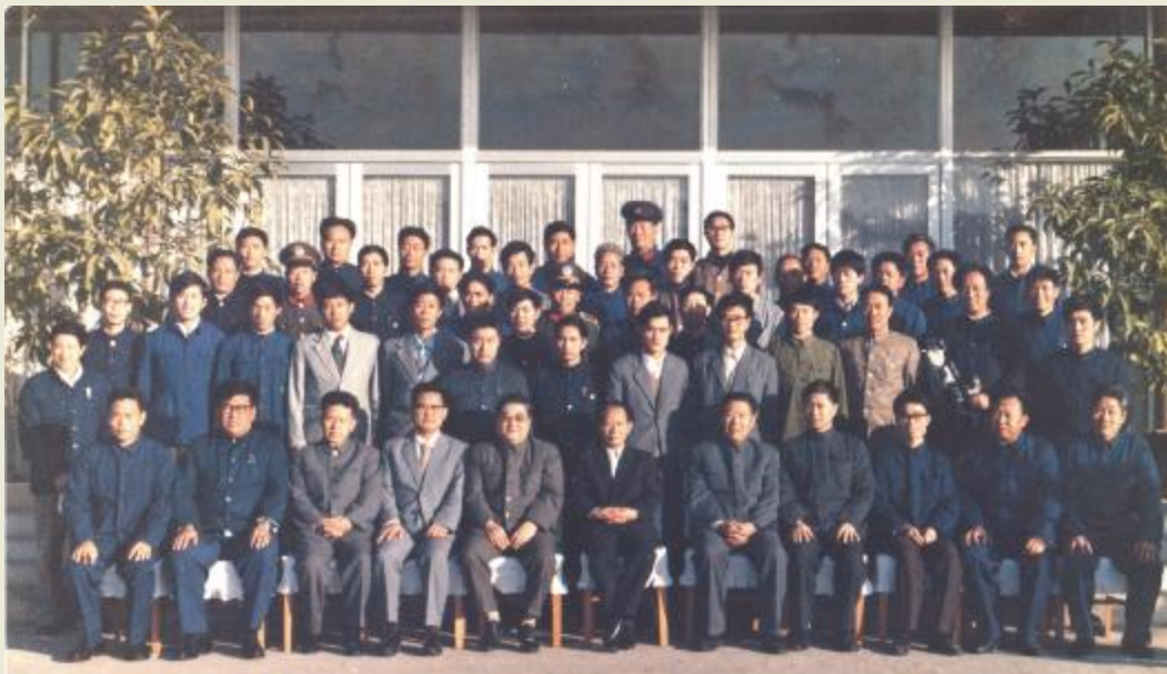
胡耀邦与陪同的省市领导及服务人员合影(前二排右起第二人为笔者)