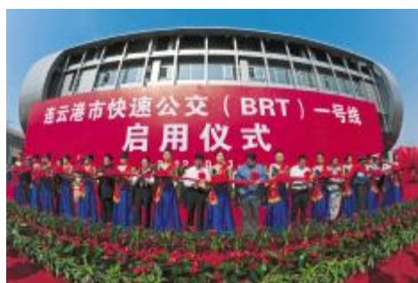
P7 BRT 一号线启用仪式