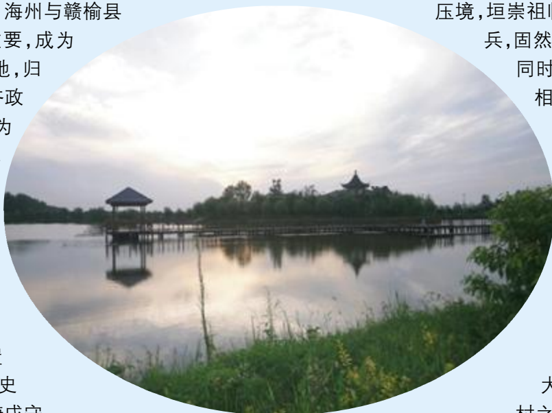
新建的赣榆罗阳艾塘湖公园

关于艾塘湖具体淤积成陆的年代,地方史志无明确记载。史学界普遍认为,艾塘湖干涸于五代时期(公元十世纪)。然而,明本《赣榆县志》中《赣榆创新砖城记》载:“樊君曰:‘县南有湖四十里,民芟牧其中’”此文所指的樊君,就是明万历年间的赣榆县令,此县志是他于明万历十九年(1590年)主修,是迄今为止发现最早的一部《赣榆县志》,所记应确凿可信。县南有湖四十里指的就是艾塘湖,说明该湖在1590年时还有南北长四十里,大致相当于青口以南墩尚以北的地域长度。但湖面较之隋唐时期已