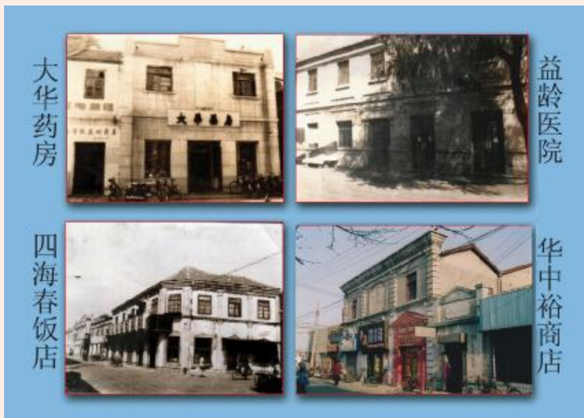
新浦老大街民国建筑