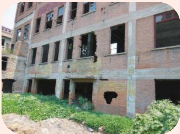
昔日的厂房早已人去楼空

有限公司。国家为了支持磷矿生产,每年给予磷矿300多万元资金补助,一直坚持到2010年。公司为了利用现有资产发展生产,于是彻底放弃矿石开采,转向发展在原有基础上的炸药制造、爆破、物流、基建等产业。锦屏磷矿90年的开采历史到2010年画上了句号。