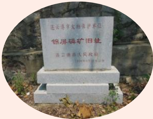
2010年锦屏磷矿旧址被设为市级文物保护单位

1. 成立保护机构对之加以保护。锦屏磷矿作为工业遗产加以保护的意義相当充分,但从目前的实际情况看,对锦屏磷矿现状的保护前景不容乐观。锦屏磷矿自2004年实行股份制改制以后,由于资源枯竭,所剩磷矿资源,每一吨亏损近20元,由于国家补贴,坚持开采到2010年,之后即使有国家补贴,仍呈现纯亏损状态。因此企业采取利用现有资源发展多种经营,将矿井中的各项设施如支架、抽水系统、送风系统等全部拆除,采选系统中的采选设备及运输、储存、加工等所有不用的设备均予以拆除变卖,用以发展具有较好经济效益的生产项目。如此一来,旧锦屏磷矿的原有面貌受到了严重的破坏。好在2010年市政府认识到锦屏磷矿遗址保护的重要性,将“锦屏磷矿遗址”作为连云港市文物保护单位加以保护。这一举措对锦屏磷矿遗址的保护起到了较好的作用,但还远远不够。如果能在旧