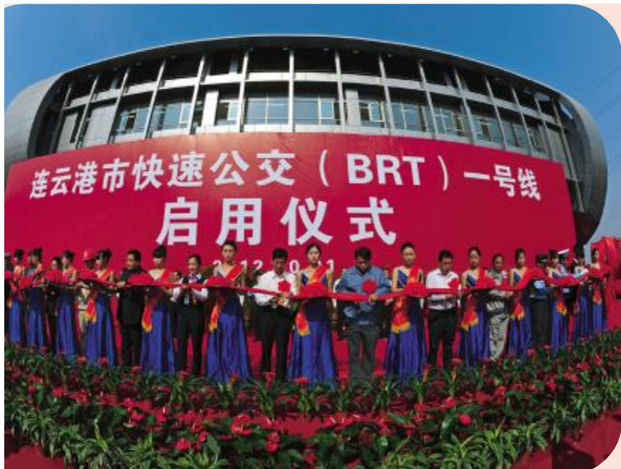
2012年10月1日,BRT一号线正式开通

2012年的国庆节,是一个值得纪念的日子。就在那一天,经过广大建设者五个多月的拼搏奋战,港城第一条快速公交(BRT)一号线顺利建成通车,连云港成为国内为数不多的拥有快速公交系统的城市。自BRT开通以来,正常运营客流量从开行前日均3.5万人次不到,到开行后的日均6.7万人次,一直到现在日均7.2万人次,越来越多的市民选择BRT出行。BRT的开通真正拉近了东西城区的距离,即使全程需要40分钟的路程,但是市民依然觉得轻松快乐。