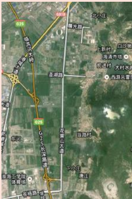
花果山片区卫星图

2006年上半年,市委、市政府决定启动花果山片区开发。花果山片区在新浦东北方向,东至花果山,西到东盐河,南至苍梧东路以南的新华村,西南与新浦新区接壤,北、西北抵新港城大道南侧,呈东西窄、南北长而又不规则形状。规划面积约22平方公里,实际