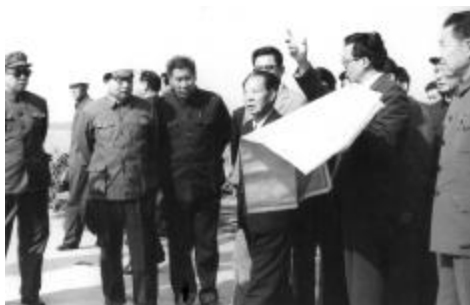
P4 胡耀邦视察连云港