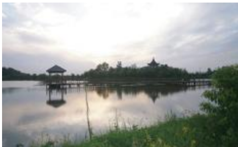
P 30 艾塘湖公园