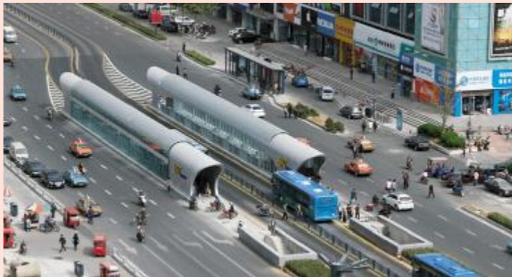
位于龙河广场的 BRT 中间站

3. 积极应对解难题。BRT 工程浩大,头绪繁多、任务艰巨,即使施工之前做了充分的预案,建设过程中仍然遇到不少难以预料的新难题。2012 年 8 月 2 日,鲜有台风的连云港突然遭受“达维”正面袭击,风力将达到 10 级。消息传来,BRT 指挥部立即制定了应急预案,成立专项