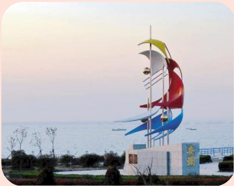
石梁河水库“安澜”雕塑