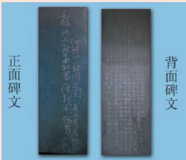
红领巾水库纪念碑