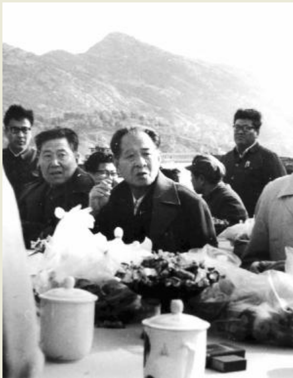
胡耀邦登艇从海上视察连云港海港

10 时 10 分,胡耀邦来到即将开工抛填的墟沟镇黄石嘴过海大堤起点,胡耀邦指出大堤建成后,要让海岛上的渔民通上电、吃上水。时近中午,陪同的市委书记季允石、市长何仁华提出准备返回时,胡耀邦兴致正高,说:“今天是星期天,可以游山玩