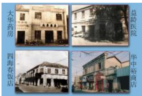
P21 新浦老大街民国建筑